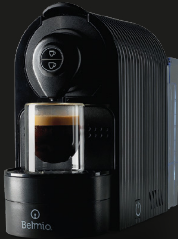
BRAVISSIMA ONYX BLACK