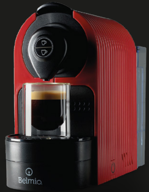
BRAVISSIMA BERRY RED